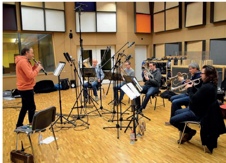
eifachs.ch im Tonstudio Gabriel