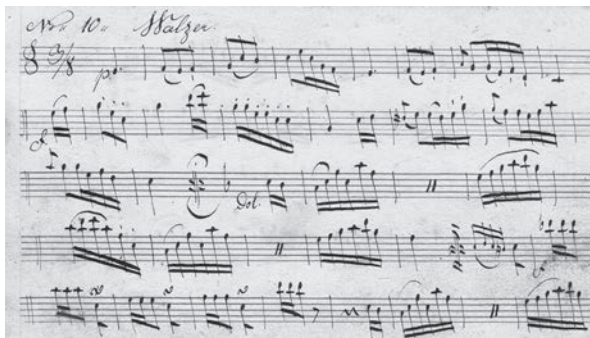
Aus der Handschrift Harmoniemusik Teufen, 1825 Walzer No. 10